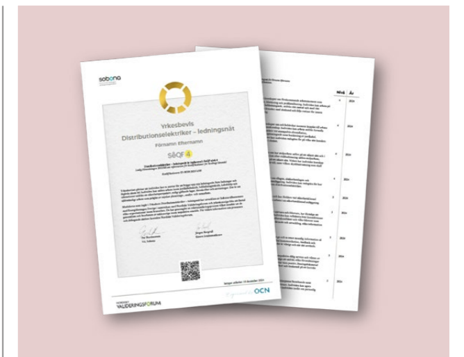
Exempel på ett kvalifikationsbevis.

Ofta är det inte själva kvalifikationsbeviset i form av kompetensintyg, kompetensbevis eller yrkesbevis som ger det största värdet. Att veta vad man kan stärker självförtroendet