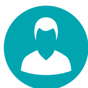
BASEL DELTAGARE JOBBSPÅR

Validering är till för dig som vill synliggöra din kompetens. Exempel på vem det passar för.