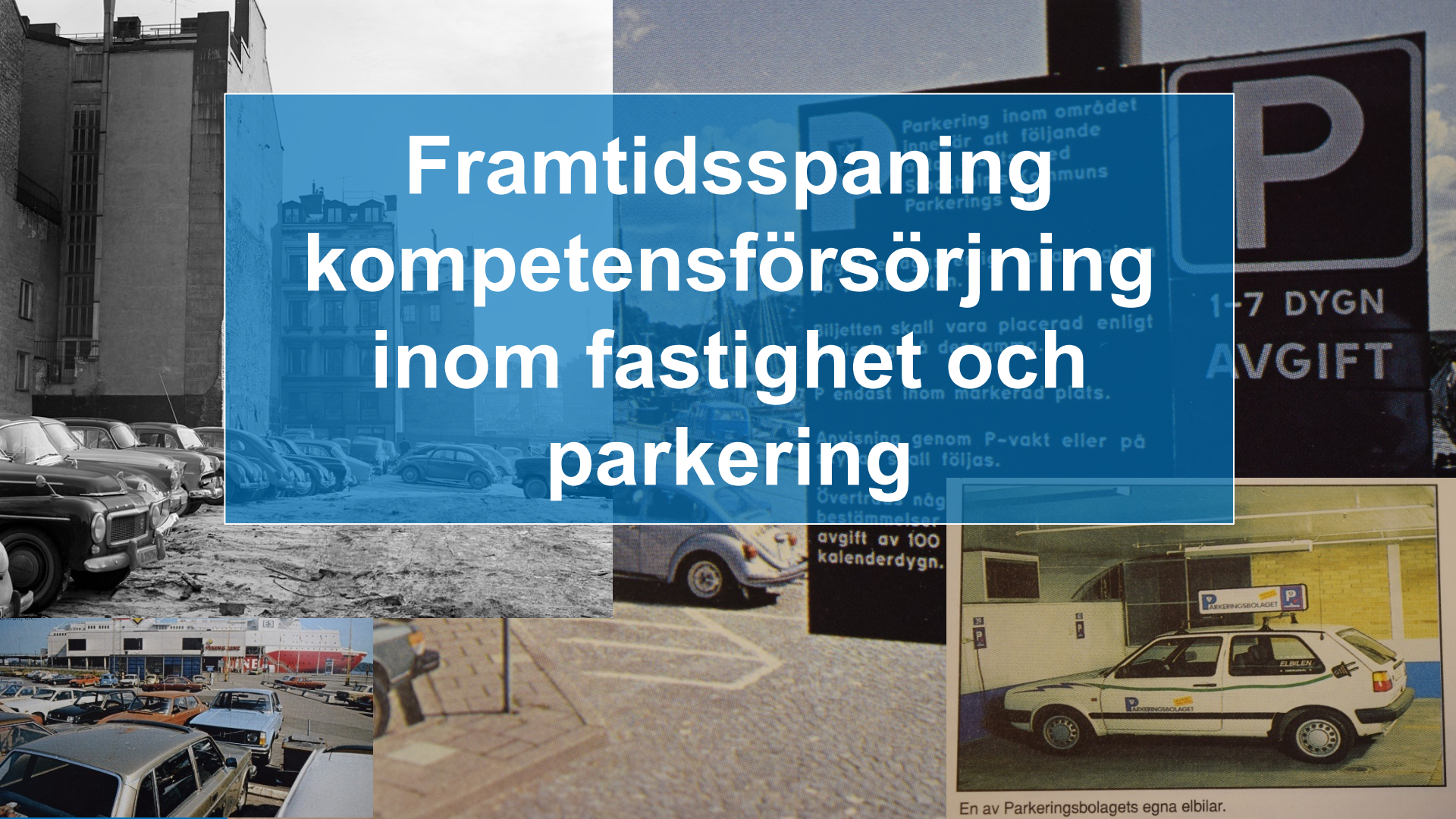
En av Parkeringsbolagets egna elbilar.