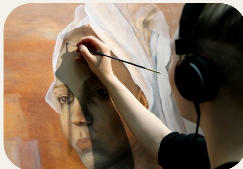
Konst- och kulturutbildningar